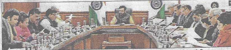
चंडीगढ़। हरियाणा मंत्रिमंडल की बैठक की अध्यक्षता करते मुख्यमंत्री नायब सिंह सैनी।

चंडीगढ़। हरियाणा सरकार ने कॉलोनी डेवलपर्स और बिल्डरों पर शिकंजा कसा है। सरकार ने ईडीसी (बाह्य विकास शुल्क) की वसूली को तेज करने के साथ-साथ पांच साल